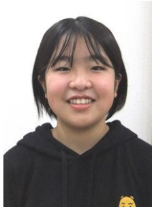
写真 しやしん は10月の珠算 しゆざん 能力検定 のうりよくけんてい 1級 つづ に続いて12月の東珠連 とうしゆれんあんざん 暗算 あんざん 検定 けんてい 1級 いっけい に合格