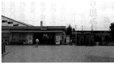
▲ 交番設置が待たれる拝島駅北口

質問 福東地域の住民 は薬局、金融、飲食等の 日常生活は南口を利用す るしかなく、拝島駅南北 自由通路が三〇年以上前 から叫ばれているがまだ 実現されていないため武 蔵野橋陸橋を渡り徒歩片 道一二分をかけて南口に いくなどの不便を余儀な くされており、時代に取 り残された行政の死角で ある。現在までの行政の