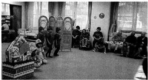
▲高齢者と園児の交流会

市長 市内の保育園では地域の老人クラブとの交流や特養老人ホームや福祉センターを訪問し、歌や遊戯、お手玉等で一緒に楽しんだり、ある保