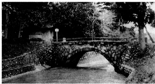
▲明治時代の牛浜橋 (通称「めがね橋」)

質問 玉川上水が国史跡に指定されるとの報道があったが、それを契機に五日市街道にかかる歴史ある牛浜橋の改良に取り組んでいただきたいが、牛浜橋はもと石づくりのめがね橋で、平成四年に現在の橋に改良されたもので、この牛浜橋が広がらないために牛浜交差点のすいすいプランが進まないで、北側の歩道を外側に新設して橋を広げ、同時に玉川上水の国史跡への指定を契機に、昔のめがね橋のような外観を有した橋にできないか伺いたい。