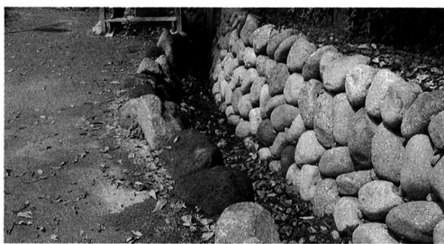
▲「下の川緑地の公園」(仮称)の下流部分

がこれ以上確保できないことや、当初期待していた湧水の分量が見込めな状況となっており、熊川分水の増水について東京都水道局に要望したが、玉川上水は水道水として利用しているものでこれ以上分水できないとのこと、現在の状況を改善するためにできるだけ早期に整備を考えてまいりたい。