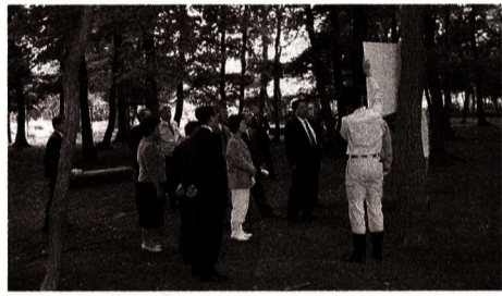
▲原ヶ谷戸緑地を視察

福生市学童クラブ条例の一部を改正する条例については、児童福祉法の改正により、条文の項の番号がずれるもので、特段の議論はありませんが、委員より、学童保育の待