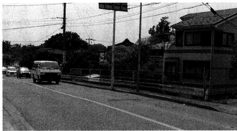
▲ 都道165号線の未整備部分

質問 都道一六五号線 の新橋から永田橋までの 道路整備は都施行で実施 されているが、北側の歩 道部分が大変危険で、ま た長期にわたる整備は、 当初の計画とずれがある のではないかと。現在の進 捗状況と今後の予定、ま た交通安全対策について 伺いたい。