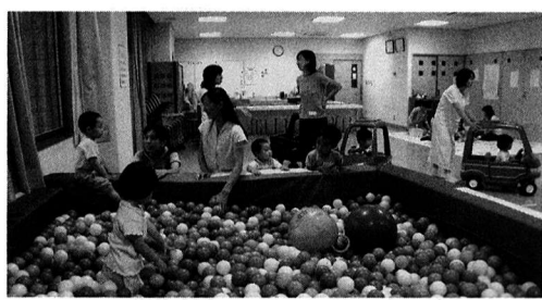
▲ふれあい子育てサロン「ほっとひろば」(福祉センター)

側、子側ともに気持ちいいと感じられる子育ての環境の整備が急がれるのではないかと。計画されている子ども家庭支援センターはどのような視点をもち、どこまで決まっているのか伺いたい。 市長 一四年度に立ち上げた検討部会から、子ども家庭支援センターを