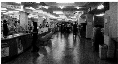
▲ 市役所一階ホール

質問 市民サービスの 充実策として、以前から 何度も土曜日・日曜日の 開庁についての要望をし てきたが、職員の配置の 関係、あるいは費用の関 係で実現しなかったが、 既に近隣市でも実施され ているので、ぜひ実現し ていただきたいがどうか。