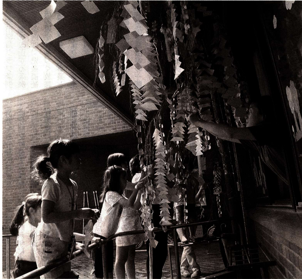
▲星に願いを(田園児童館「七夕飾りをつくろう」)

等し、その他、条例の一部改正五件、福生市特別土地保有税審議会の廃止条例一件、補正予算二件を各委員会に付託。また市行政に貢献された方を表彰する自治功労表彰八件と一般表彰一件についてそれぞれ同意し、陳情三件を所管委員会に付託し、三日目を終わりました。