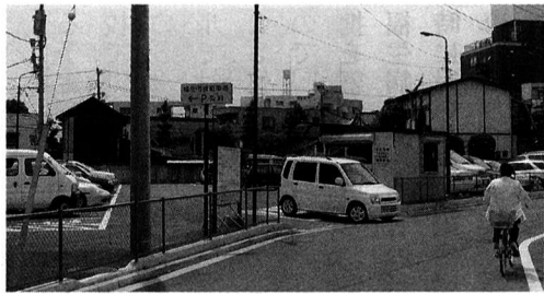
▲立体化が待たれる市営駐車場

質問 横田基地で平成五年、訓練時にドラム缶三五〇本分に当たる航空燃料が漏れ、アメリカ軍による大変な努力による修復作業が続けられてきたが、一〇年たつ現在、地下水汚染への影響など最終的な安全宣言はどうか