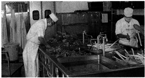
▲ 調理される学校給食の食材

質問 市内小学校では 環境ホルモンが出にくい 食器を使用し、食器の洗 剤はせっけんを使うなど 安全対策がなされている が、遺伝子組み換え食品 等の食の安全対策はどう か。中学校では順次ラン チルームが業者委託で運 営されていくが、食の安 全対策はどのようになさ れていくのか伺いたい。