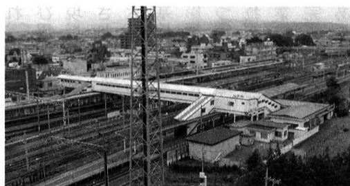
▲現在の拝島駅通路

議会の質問に対して子ども家庭支援センターの設置に向けて検討していきたいとの回答をいただいたが、検討結果と近隣市の状況、設置場所や実施時期、方向性について伺いたい。 市長 一四年度に設置した検討部会からは設置に向けての報告を受けている。近隣では二六市が一六市が設置済みで、各市とも既存施設内に設置し、事業内容も相談を中心として必要最小限の規模で実施しており、当市でも既存施設を利用して現職体制の中で創意工夫して設置していくことになるが、現行の子育て支援策は国、都からの縦割りのもので、市がそれを実施しても効果的ではなく、保護者や子供にとって本当に必要なものを分析して行政やボランティアがその処理に当たるシステムづくりが必要だと考えており、プロジェクトチームの検討結果も見ながら福生型といったものを考えてみたいと思