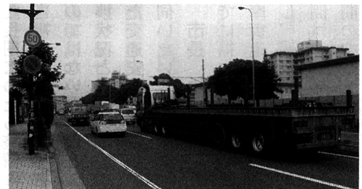
▲慢性的な渋滞の国道16号線

市長 一六号線は市の都市基盤を支える幹線道路であり、地域の産業経済や社会・文化活動を支えるとともに人、物、情報等の交流を図るための道路としても必要不可欠な幅員二四メートル、車道四車線、商店街側に三