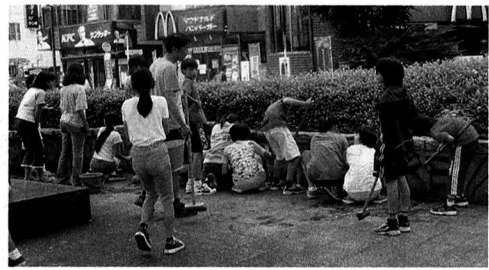
▲きれいにしましょう (第一小学校六年生)

業で環境に関する内容を扱っている。さらに小学校では、総合的な学習の時間に取り上げている学校もある。また一小では福生駅周辺の落書き消し等、二小は自然環境保護の学習、三小はごみの分別とリサイクル、五小は多摩河原の清掃、六小は水のリサイクル、七小はごみ、河川の汚れ等をテーマにそれぞれ環境学習に取り組んでいる。また