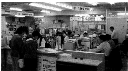
▲介護福祉課の窓口

市長 介護保険事業の円滑な運営とともに、要介護高齢者の自立へ向けた生活支援サービスや、虚弱高齢者に対する介護予防等サービス、元気高齢者に対する健康づくり対策等の高齢者福祉施策の充実が重要と考えている。このため国や都の包括補助制度の拡充と市で