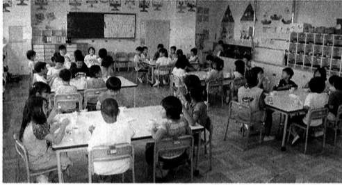
▲武蔵野台学童クラブ（おやつ時間）

●福生市学童クラブ条例の一部を改正する条例 本条例は、児童福祉法の規定に基づく放課後児童健全育成事業としての学童クラブ事業について規定しているものであるが、平成一二年に公布された社会福祉の増進のための社会福祉事業法等の一部を改正する法の施行による児童福祉法の一部を改正するもの。