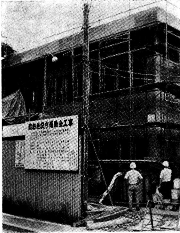
完成間近い保健相談センター

問 西多摩の表玄関といわれ る福生駅には公 衆便所がないが つくる考えはあ るか。 市民部長 問 題は場所、駅 の付近というこ とになる。西口 開発の計画の中 に入っているが 整備後でなけれ ば用地の確保は できない。商店