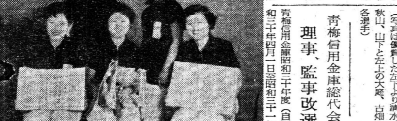
第十回西多摩柔道大会 女子は福生が一位 男子は青梅が一位

生活改善の推進を図る。具体的には、生産者の生活環境の改善と、生産環境の改善を図る。具体的には、生産者の生活環境の改善と、生産環境の改善を図る。