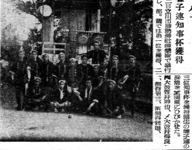
豊坂に交番を建てた 多西村婦人会