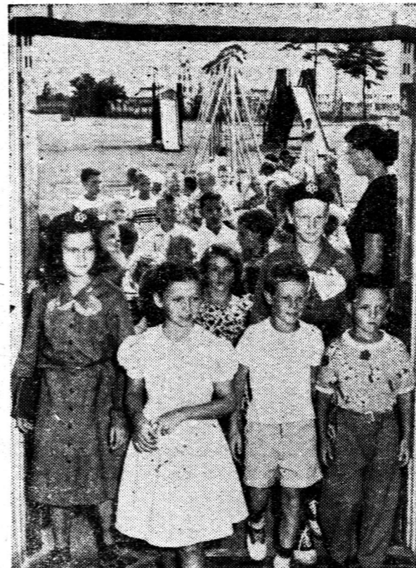
日本の子供さんと遊びたいそうです 横田空軍基地の子供さん達が