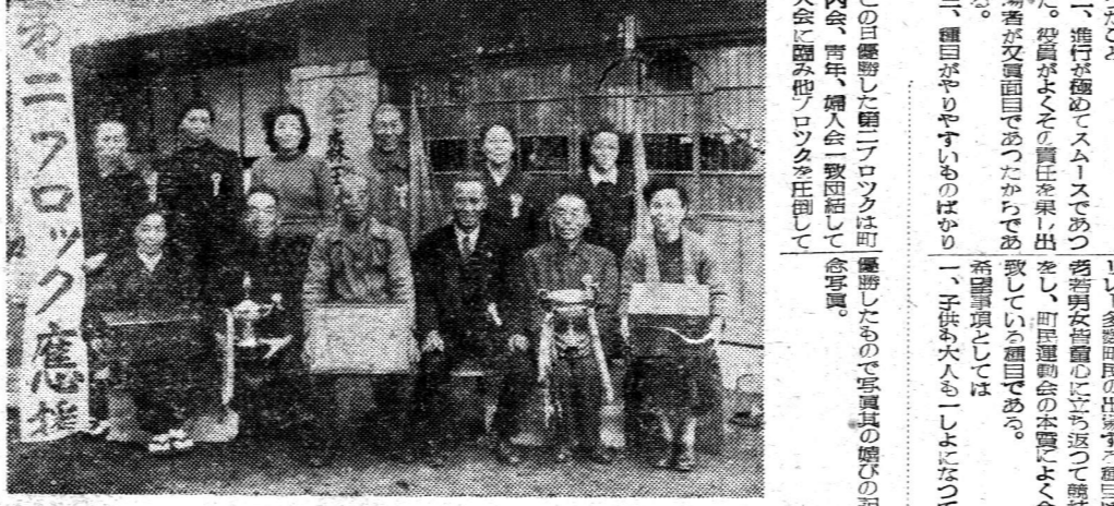
福生町民体育祭の綱引 福生町民体育祭の綱引の様子。参加者たちは力いっぱい綱を引っ張っている。観客も応援している。

福生町民体育祭は、十一月十四日、十五日の二日、福生町公民館を会場として、西多摩町民体育祭と合同で開かれた。この日は、朝から爽やかな秋晴れで、多くの観客が参加した。午前八時開始の旗开得勝で、福生町民体育祭の部では、男子部が優勝、女子部は瑞穂町民体育祭の部と合同して開かれた。この日は、朝から爽やかな秋晴れで、多くの観客が参加した。午前八時開始の旗开得勝で、福生町民体育祭の部では、男子部が優勝、女子部は瑞穂町民体育祭の部と合同して開かれた。