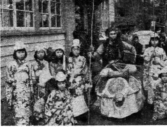
福生第二の町民体育祭 福生第二の町民体育祭の様子。参加者たちは元気よくポーズをとっている。

福生第二の 研究発表會 福生第二の研究発表會は、十一月十四日、十五日の二日、福生第二公民館を会場として開かれた。この日は、朝から爽やかな秋晴れで、多くの観客が参加した。午前八時開始の旗开得勝で、福生第二町民体育祭の部では、男子部が優勝、女子部は福生町民体育祭の部と合同して開かれた。