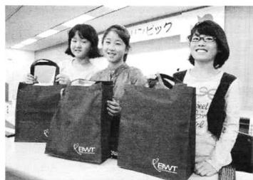
袋いっぱいのお品をもらいました!