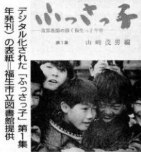
デジタル化された「ふっさっ子」第集(1-69)

山崎さんは出版当時は英オックスフォード大の図書館も興味を示し、本と月報を送ったのを覚えていて、今の子供との違いを読み取ることもできるはずと話している。意見はテーマ別にまとめられている。【ハルーフサウンズ】『87年(第3集)』天人はアルバムサウンドをきこう。かみ