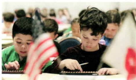
アメリカンスクールそろばんコンテスト

アメリカンスクールに通う小中学生117人が参加し恒例のそろばんコンテストが行われた。「指を使って計算するそろばんは右脳と左脳の平均的発達を促す」との考えで授業にそろばんを探り入れている＝15日、都内(2013-05-15)