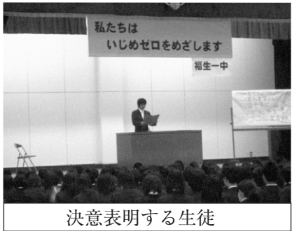
決意表明する生徒