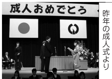
昨年の成人式より