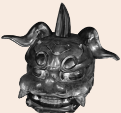
寄贈された獅子頭