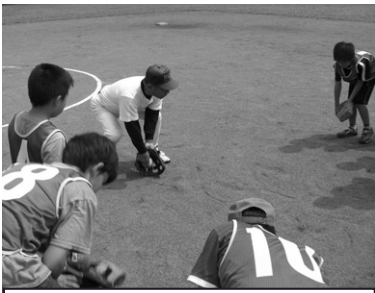
ジュニア育成の様子

くの参加のもと、一人でも多くのトップアスリートが育つてもらいたいことを望むとともに、地域におけるスポーツの振興の名のもとに、学校、地域、競技団体とが連携し、関わりをもつて、より良い「指導育成環境」が整備されればと考えております。