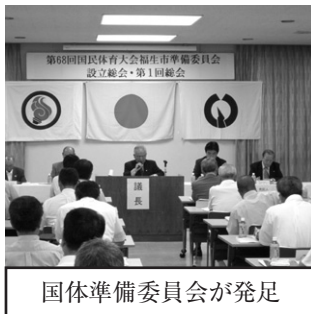
国体準備委員会が発足

有効な支援に関する研究を進めております。この研究は、児童・生徒の学力向上を目指すことや不登校児童・生徒を一人でも減らすことにも役立つはずです。この研究は全国的にも先駆的なものです。成果が現れれば、子どもたちが学ぶことや楽しさを全身で感じることができる学校となります。そのためには、教職員や保護者の皆様ばかりでなく全ての市民に関心を持っていたいただく必要があります。