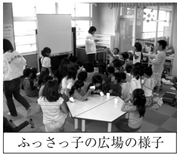
ふっさっ子の広場の様子

青少年育成地区委員長会主催事業（ふっさ輝きフェスティバル・軽スポーツ&とん汁会）の支援