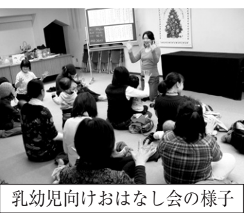
乳幼児向けおはなし会の様子