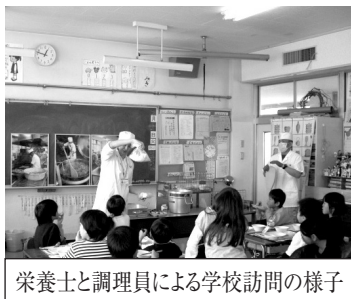
栄養士と調理員による学校訪問の様子

また、学校訪問を通して、児童から給食に関する感想や質問を聞き、献立を作成する参考としています。