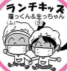
ランチキッズ 福つくん&生つちゃん

て、栄養士と調理員で月2回各学校の給食時間に1クラスを訪問し、学年に合った給食の紹介やその日の給食を使った栄養指導を行っています。学校訪問は、みんなで食べる給食を通して、色々なことを学ぶことを目標にしています。