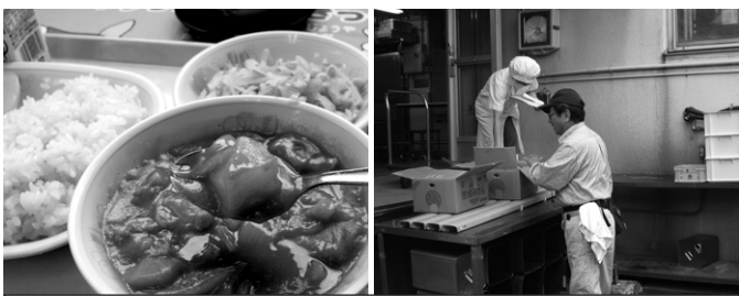
地元農家の方による納品の様子と地場産野菜で作ったカレーライス

その日は、「地場野菜」を提供していただいた農家の方々の試食会を開き、学校給食のカレーライスを食べていただきました。カレーライスに身した、皆さんの育てた「じゃがいも」と「たまねぎ」を試食した感想をお聞きしたところ、「大変美味しい」と好評で、今後も出来る限り学校給食への「地場野菜」の提供にご協力をいただけたとの嬉しいお言葉もいただきました。また、一月には、「七草すいとん」に農家の方のご協力で福生産の「だいこん」を使用しました。