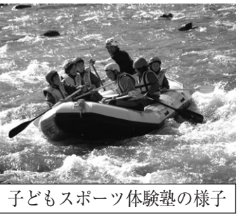
子どもスポーツ体験塾の様子