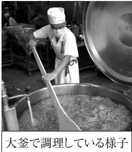
大釜で調理している様子