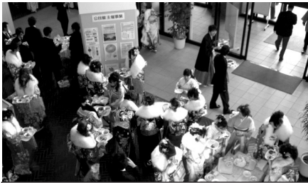
今年の「懐かしの給食コーナー」より

学校給食センターでは、「小学生時代に食べた給食を食べたい」という皆さんのリクエストに応え、毎年成人のつどいの会場に「懐かしの給食コーナー」を設け、成人の皆さんに小学生時代に食べた給食を思い出していただいています。