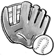
子どもスポーツ体験塾の様子