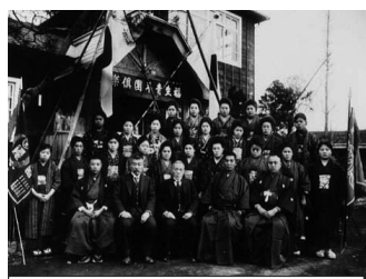
福生市青年団倶楽部落成式