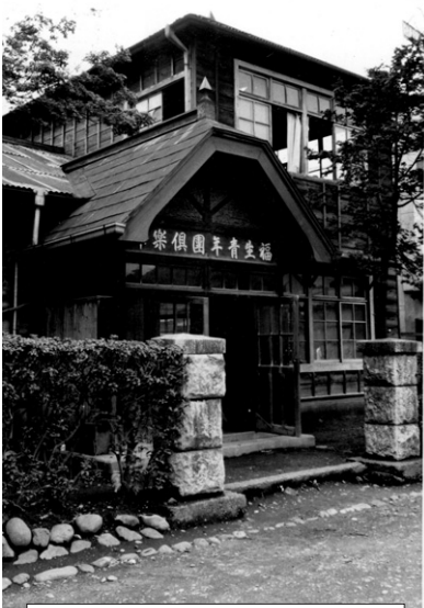
福生青年団倶楽部と門柱

登録方法や利用の仕方は、市内の図書館で配布しています「西多摩8市町村図書館ガイドブック」をご覧ください。