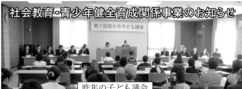
昨年の子ども議会