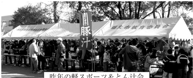
昨年の軽スポーツ&とん汁会