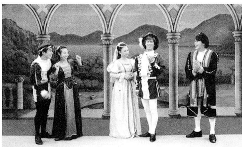
ベニスの商人から

今回の演劇鑑賞会は、一部として、劇団め組による公演「ベニスの商人」(80分)と、二部では、演劇教室(20分)が実施されます。