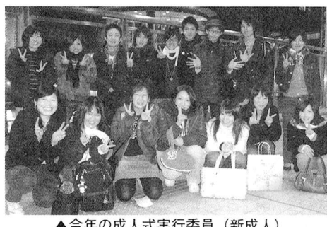
▲今年の成人式実行委員(新成人)

昭和60年4月2日から昭和 61年4月1日までに生まれた 方に案内状を送りました。届 いていない方は、社会教育課、