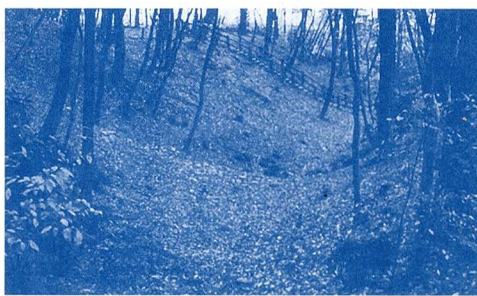
みずくらいど (市指定史跡)

民俗文化財 有形の民俗文化財：衣食住、生業、信仰・年中行事等に用いられる衣服、器具、家屋等。 無形の民俗文化財：衣食住、生業、信仰・年中行事等に関する風俗慣習、民俗芸能等。 記念物 遺跡：貝塚、古墳、城跡、旧宅等。