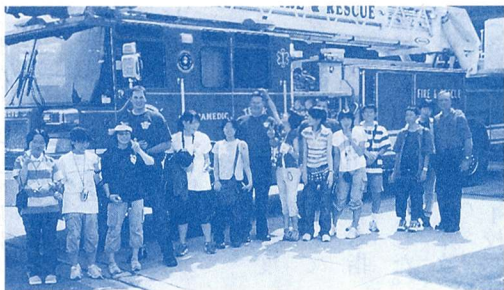
元気に消防署見学をする生徒たち

新学習指導要領の実施から二年目に入りましたが、いまだ学力低下への懸念がさまざまに叫ばれています。