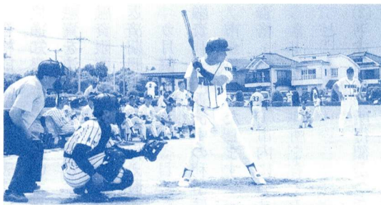
オール福生(壮年)試合風景

図書館には、現在40万冊の図書があり乳幼児から高齢者まで様々な方に利用されています。年間の貸出点数は14年度で70万3千点に達しております。 しかし、残念なことにこころない人により盗難・切り取り・いたずら書きなどがあり、毎年1千8百冊もの不明・使用不能等の図書が発生しています。図書館の資料は市民の大切な共有財産です。利用にあたっては、マナーを守るようお願いいたします。