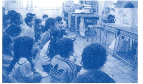
低学年児童絵本コーナー授業風景

基礎基本の定着を図る手段の一つとして、本校では、特に読書活動に力を入れています。教職員を中心に、保護者や地域の方々による図書ボランティアの協力を得ながら、魅力ある図書室作りや読書環境の整備を進めてきました。コンピュータによる本の貸し出しや蔵書の管理、低学年用の絵本コーナーなどがあります。また、イラストマークによる分かりやすい分類表示や月ごとに変わる推薦本コーナーなど、様々な工夫をしています。