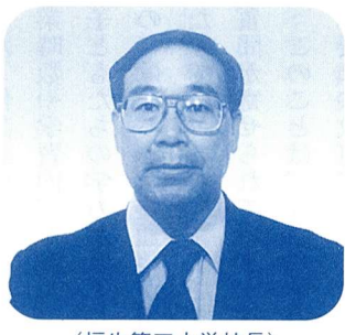
(福生第五小学校長)