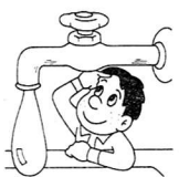
水道について 相談コーナー等の開設

6月1日から7日までの一週間は「水道週間」です。東京都水道局では、各種の行事を予定していますが、福生市でも期間中に、節水、料金(メーター器の指針の見方や料金計算の仕方)、給水装置(ジャグチコマの取り替えの実演)等「水道」についての相談コーナーを開設します。皆さんお誘い合わせのうえご来場ください。 なお、ジャグチコマや記念品等を無料配布いたします。 相談場所は、左の表の会場で行います。