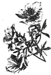
市の花/サツキ(ツツジ)

昭和五十五年十月一日から昭和五十六年三月三十一日までに生れた赤ちゃんに出生記念樹として、市の木モクセイ(高さ一五〇センチメートル前後)を、また団地にお住いの方には市の花ツツジ(高さ三〇センチメートル前後)をプレゼントします。該当者にはハガキで通知しますので、次の会場でお受け取りください。ハガキが届かない方は、母子手帳など出生を証明するものを持って該当する会場でお受け取りください。 なお、当日会場においてられない方は、四月二十日(月)午前九時から午後五時までに経済課農業緑化係へおいでください。