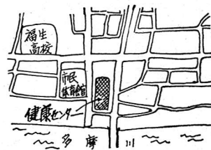
▼健康センター案内図

予定しています。 ※麻しんの申し込み及びその他の健康管理についての相談は、毎週土曜日午前九時から十一時三十分まで健康センターで受け付けています。ご利用ください。 アメリカシロヒトリ 防除作業員 期間：六月一日～九月中旬 募集人員：若干名 募集対象：普通自動車免許をお持ちの満十八歳以上の方 日当：三千八百円。ただし高校生は三千六百円。必要書類：履歴書一通 申込先：お問い合わせ☎五月十二日（土）までに経済課農業緑化係へ。☎51-1511 内線273