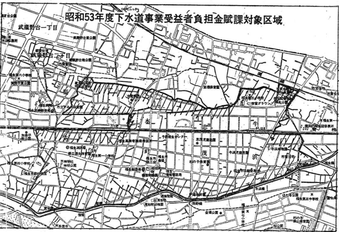
昭和53年度下水道事業受益者負担金賦課対象区域