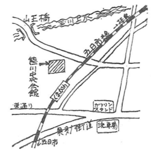
熊川中央会館案内図

小学校一年から三年までの児童で放課後帰宅しても共働きや病気が対象です。ただし、心身に著しく障害のある児童は除きます。時間は、下校時から午後五時まで、費用は無料です。なお、すでに入所している児童も申請してください。