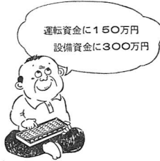
運転資金に150万円 設備資金に300万円

五十万円を超える場合は 三十六か月以内 設備資金 百万円以下の場合 四十八か月以内 百万円を超える場合は 六十か月以内 利率 年七・五パーセント以内 (利子補給率年一・五パーセント) 実質年六・〇パーセント以内 保証 一、連帯保証人一人以上 ただし、審査会が必要と認められた場合は、保証協会の保証を必要とします。 二、融資の合計額が三百万円を超える場合は、連帯保証人一人以上と、保証協会の保証が必要とす。 取り扱い金融機関