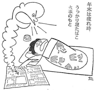
年末は疲れた時 うっかり寝たはら 火事のせいで

年末は、市民生活を脅かすいろいろな犯罪が多くなります。 特に、デパート、スーパーマーケットなどの買物客や、銀行などの行き帰りをねらう「スリ」「ひったくり」や主婦を対象とした悪質で強引な「サギ」「訪問販売」などの被害に合わないようご注意ください。