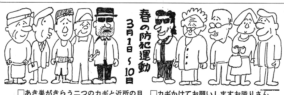
□あき葉がきらう二つのカギと近所の目 □カギかけてお願いしますお隣りさん

ところで、あなたはこの四人の一人に仲間入りできますか。お隣りが年金を受けられる時にあなたも年金を受けられるでしょうか。すでにかけ金を納め終って老齢年金を受けている方、途中、事故で障害者になって障害年金を受け