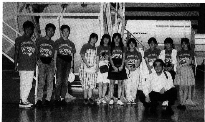
▲ 昨年のジュニア大使友情使節団 (NASA宇宙センターにて)

発行 福生市 〒197 東京都福生市本町5 編集 企画財政部企画調整課 市役所の代表電話番号 ☎ 0425-51-1511