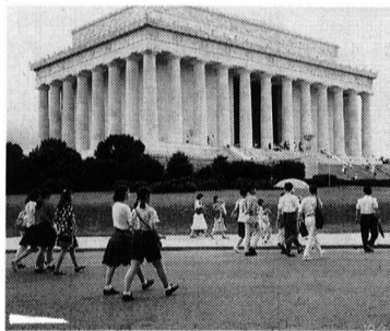
▲ リンカーン記念堂を見学