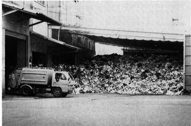
▲燃えるゴミを処理する西多摩衛生組合

現在新たな施設建設に向け計画をしているところですので、現施設で処理していくには皆さんの一層の協力が必要です。ごみの中には新聞、雑誌、ダンボール等、資源となるものかなり含まれています。資源となるものは町会等で行っている資源回収に出し、資源の保護とごみ減量にご協力ください。また、生ごみの水切り、燃えるごみ、燃えないごみの分別の徹底をお願いいたします。