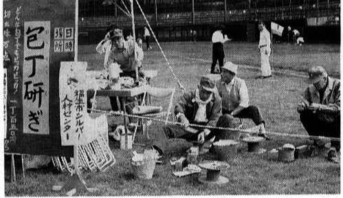
▲ふっさ健康まつり(10月21日)での包丁研ぎ

センターも今年で11年目を迎え、平成元年度の契約金額も2億円を突破しセンターの需要も、ますます増える一方です。ところが、センターも、会員不足で、受注に対応できないことも、しばしばの現状です。センターでは会員の増強作戦に力を注いでいます。働く意欲のあるおおむね60歳以上の福生市民の方なら、どなたでも入会できます。 入会手続きは簡単です。お気軽