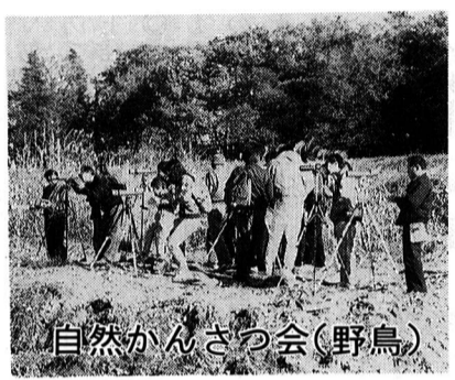
自然かんざつ会(野鳥)

申込み 12月5日(水)から各 館で整理券を配ります。 ※お問い合わせは、各図書館へ