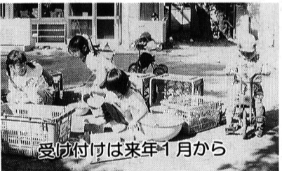
受付付けは来年1月から

平成3年度の保育園入園申し込みの受け付けが始まります。 受付期間 平成3年1月7日(月)～19日(土) ただし、第2土曜日、土曜日の午後、日曜日、祝日は除きます。 受付場所 福祉事務所（市役所1階） 申込用紙 申込用紙は12月15日(土)から福祉事務所でお渡しします。現在通園中で、平成3年4月以降も続けて入園を希望される方は、継続調査書と必要書類