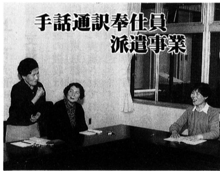
手話通訳奉仕員派遣事業

理等に関するとき手話通訳奉仕員を派遣します。なお、手話通訳奉仕員を募集していただきますので、希望者は福祉事務所へお問い合わせください。