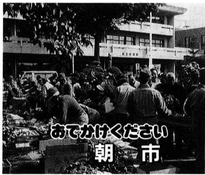
あてかけください 朝市

4月に多摩川に新しい公園が開園しました。この公園は市内で一番大きく面積六万五千五百七十六㎡あります。今年市制20周年にあたり5月27日(日)にこの公園の開園式を行います。市民の皆さんには大人も子供も参加できるイベントを予定しています。また、イベント参加者には苗木を配布します。くわしい内容については5月15日の広報でお知らせします。