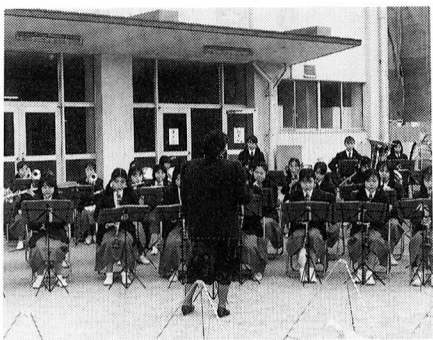
消防団出初式にて

福生第二中学校吹奏楽部が、幅広い地域での奉仕活動を認められ、3月3日(土)東京都教育委員会から表彰されました。同校吹奏楽部は、現在部員48