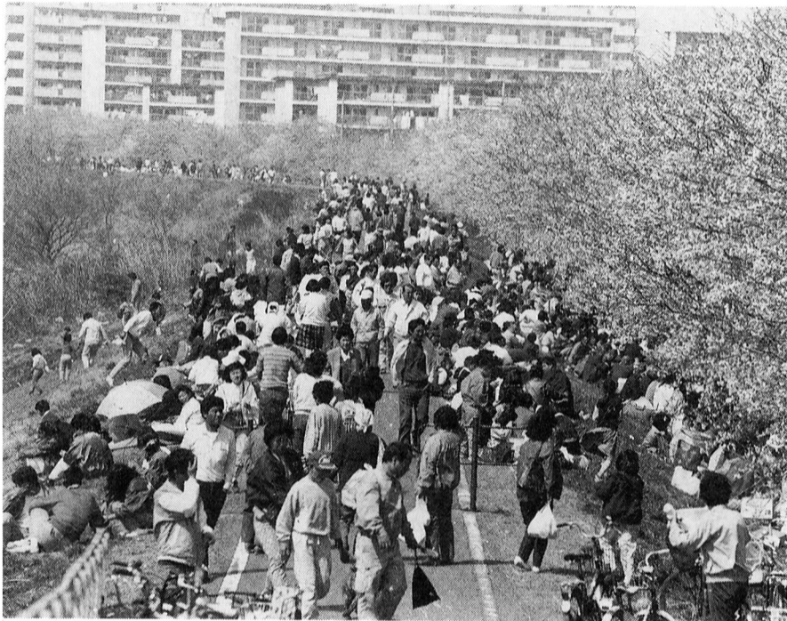
▶賑わう多摩川堤(明神下公園付近)

催し物 ☆民踊パレード及び仮装行列 4月8日(日) 午後12時30分 〜3時30分 柳山公園から睦橋までの間 ☆おはやし 4月8日(日) 正午から 山公園から睦橋までの間 ☆野だて 4月8日(日) 午前11時〜午 後3時30分 明神下公園、柳 山公園付近 ☆仮設舞台での催し(長唄、民 謡、カラオケ) 4月8日(日) 正午〜午後5 時 桜公園付近多摩川堤 ☆福生消防少年団鼓笛演奏 4月8日(日) 午後2時30分 〜3時30分 明神下公園 ☆写真コンクール 期間中 主催 ふっさ桜まつり実行委員 会 ※期間中、付近の方にはご迷惑 をおかけしますが、ご協力を お願いします。