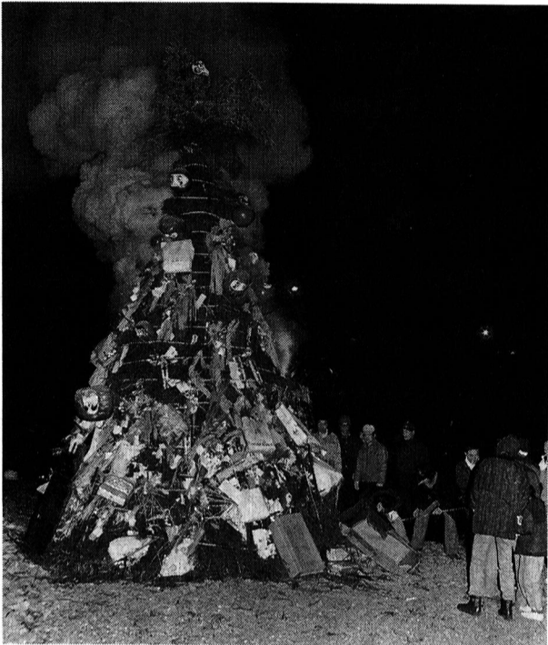
志茂一町会で行ったどんど焼き（1月15日）

希望される方は、3月5日（月）から23日（金）まで（ただし、土、日曜日、祝日を除く午前9時から午後5時まで）に教育委員会庶務課庶務係（☎52-5568）へお申し込みください。