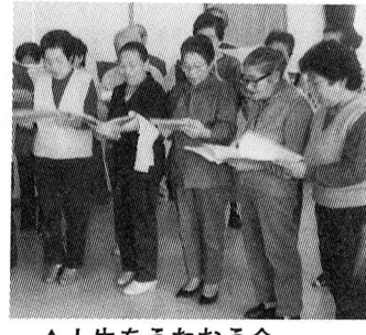
▲人生をうたおう会

▽日時 文化祭ほか発表会前に随時実施 内容 陶芸作品づくりと展示会出品参加(初心者の方も結構です) ※なお、どの「会」とも▽場所 白梅会館 対象 高齢者の方はじめ、どなたでも ▽申込み・問合せ 11月1日(水)から白梅会館(☎53-3454)へ。