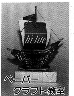
ペーパークラフト教室

たばこの空箱を利用して帆船を作ります。どなたにも手軽に作れますので、お誘い合わせのうえお出かけください。なお、材料等は用意いたします。