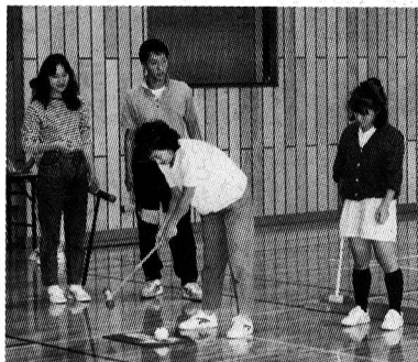
市民体育館・熊川体育館

※各種目とも入賞者には、賞状と賞品を授与いたします。 ※8日(日)、10日(祝)とも午前9時から午後5時までの使用料及び各種大会の参加費は無料です。 問合せ 申込み 熊川体育館(☎52-1980)へ。