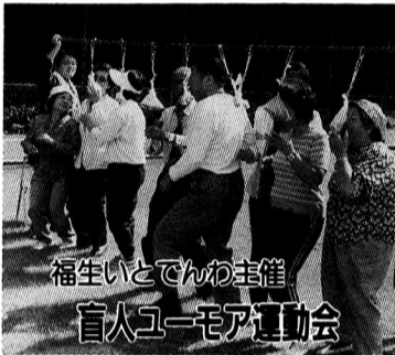
福生いとでんわ主催 盲人ユーモア運動会