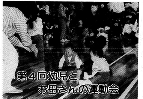
第4回幼児とお母さんの運動会