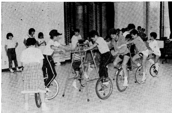
— 7月3日(水) 田園会館一輪車教室 —