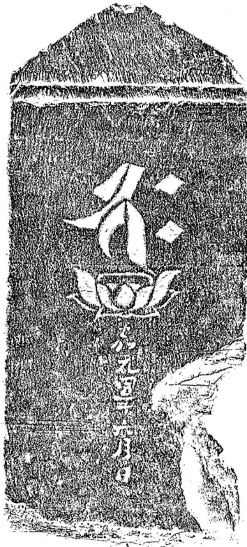
▼福生市現存板碑の時代別分布