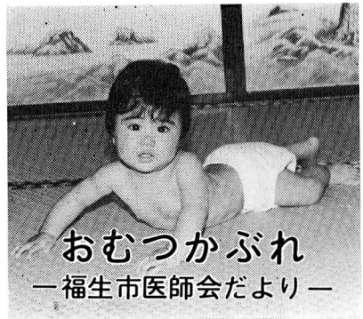
おむつかぶれ —福生市医師会だより—

なお、受診は緊急の場合に限ります。また、受診の際は保険証と小銭をご用意ください。