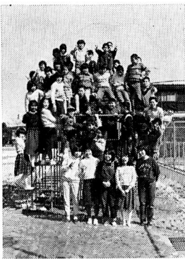
今月の表紙は、「ボクたちもうすぐ」