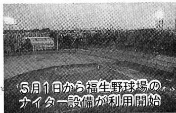
5月1日から福生野球場のナイター設備が利用開始

◎5月1日から、福生野球場のナイター設備が、ご利用になれます。ナイター開場期間は、5月1日から10月31日までです。