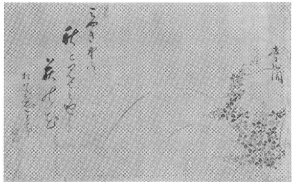
▶太田蜀山人筆「萩の図」松原庵星布筆画賛

「俳諧」というより「俳句」と言いかえた方がわかりやすいかと思えますが、私たちの生活する多摩地域をはじめ江戸時代も後期になると各地で俳諧を愛好する人びとが生まれます。一般庶民の積極的な文化創造への参加がはじまったわけです。江戸の宗匠へ自作の句を送り点削指導を受け、そのグループで発行する句集へ登載されたりするわけです。地域においては、同好の士で句集を出したり、寺社への句額奉納といった形であられます。また江戸に住む著名俳人をはじめ、文芸家たちの来訪がひんぱんとなり、やがてそれは地域文化(在村文化)として開花して行きます。そのような地域における歴史をもつ俳諧などから、地域の伝統文化のあり方や人びとの思想を明らか