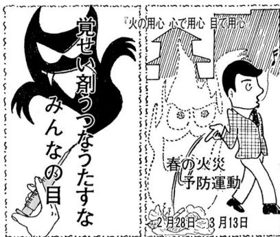
(2月は覚せい剤撲滅月間です)