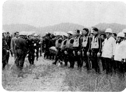
▲ 5月15日 第八方面本部総合水防訓練