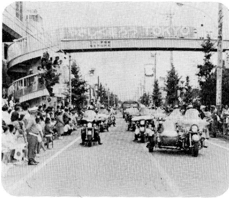
▲ 9月20日 日米親善交通安全フェスティバル『オートバイパレード』