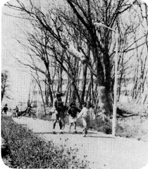
▼ 4月1日 市道第303号線完成