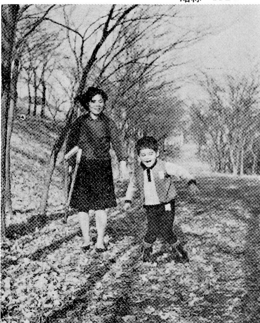
お母さんに見守られて歩行訓練