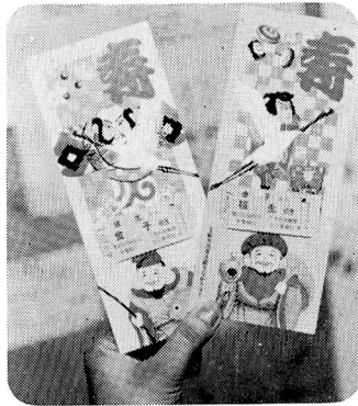
▲ 1月1日 福生駅で記念切符発売『福生駅⇄金子駅』