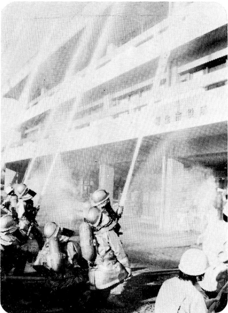
▲ 11月29日 火災防禦訓練 (市役所にて)