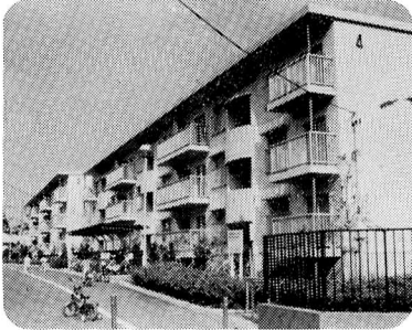
▼ 2月28日 市営住宅完成 (建替え)