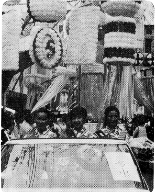
▲ 8月6～9日 第31回 福生七夕まつり『ミス七夕パレード』