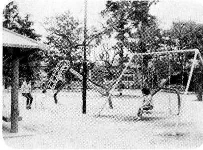
▲ 3月31日天神児童遊園完成