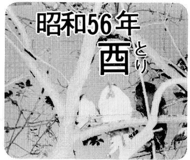
▲ 高い木の枝にとまるニワトリ