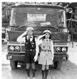
▲きみもほくも あなたもわたしも 消防少年団員!!

日（月）までは図書の貸出冊数を特に制限しないで貸出します。期間中、わかざり・わかたけ会館の会議室はご利用できません。 また、三月十八日（水）から平常どおり開館し、十九日は第三木曜日ですが開館いたします。