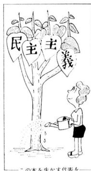
この木を生かす代表を

都知事選挙と市議会議員選挙の開票は、翌日開票です。午前八時から商工会館で行う予定です。