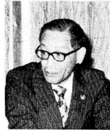
市長、みなさん、おめでとうございます。

立場で、子供たちの教育に三十年余り取り組んでこられた先生方にお集りいただきました。