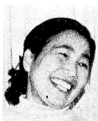
主婦とチキート、それぞれ、いろいろなことをやっているので