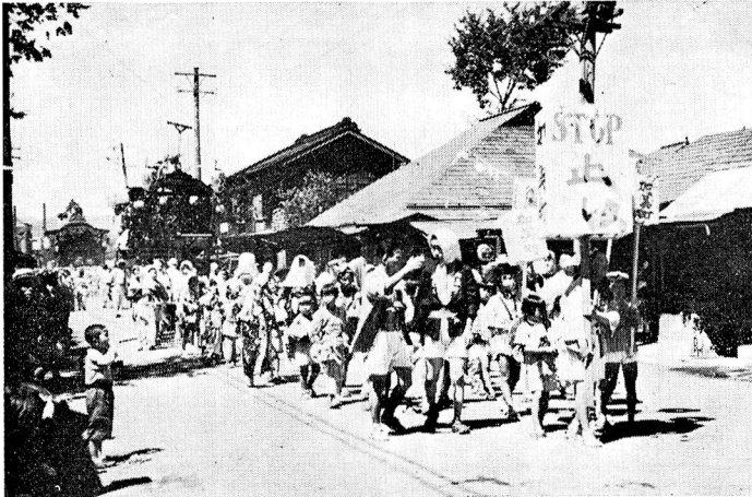
福生駅西口前、中央通り の光景