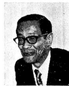
市長 私は、いまの第二小学校 に通った んです。 守屋君の 先輩とい うことに なります

今年は、福生市が市制をしてから五年になり ます。 そこで、四月には中学に進学する市内の小学生七 人にお出でいただき、小学生の目でみた福生のこと などを語り合っていました。