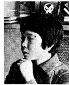
市長 私 たちの考 えは、学校はたくさん作って、少 ない生徒で先生が教えるように した方がいいと思っているんで す。大勢の生徒では先生の注意も 十分でなくなりまし、みなさん も、先生とお話する機会が少な くなりますから。 もちろん、みなさんのお話しのよ うに、生徒数が多いことの長所も ありますが、どちらかという一 クラスの生徒は少ない方が、長所 がより大きいと思っています。