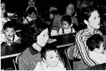
△優良児もちょっとおすまし

十月三日、二十回目の赤ちゃんコンテストの表彰式が行われました。コンテストの参加者は百人。発育状態、予防接種、検診の状況を参考に審査、優良賞十五人、努力賞五人、入賞十五人が選ばれました。努力賞は、未熟児、双生児の保育に努力したお母さんが対象になります。優良賞(一)内は母親の名。敬称略