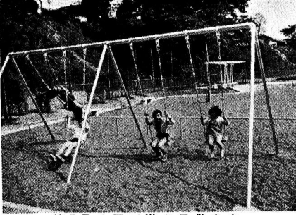
第3号公園で遊ぶ子供たち

崖から出るわき水や周囲の自然 環境を生かし、農薬や都市化にと もなう自然破壊により年々減少の 一途をたどるホタルを、この公園 で養殖し、いつまでも保護しよう と、福生ホタル研究会の人たちの