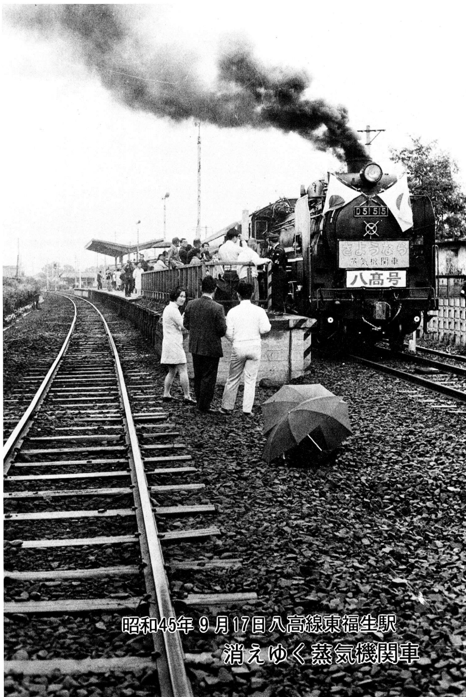
昭和45年 9月17日 八高線東福生駅 消えゆく蒸気機関車