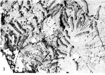
葉を食うアメリカシロヒトリ

10日〜12日間だけであとは分散してしまうので、この時期をのがさず、枝葉を切りとり、焼きすててください。