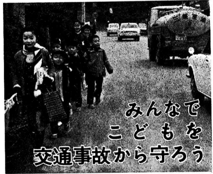
みんなでも 子どもを 交通事故から守ろう

昭和43年中、東京都内の交通事故で子どもは114人が死亡し、12,902人がけがをしています。子どもの交通事故は、寒さの厳しい1月、2月に比較して、子どもたちの屋外での活動が活発になる3月から毎年急激に増え、昨年は3月と4月で24名が死亡しています。とくに4月から新入学児や保育園児が家庭からはなれ、慣れない新しい生活がはじまりますので、これらの児童をみんなで悲惨な交通事故から守りましょう。