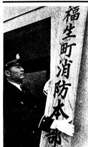
消防長を掲げる看板

建築許可に対する同意事務 あらゆる建築物の新築や増改築が、防火に因し違反しているか、いなかを審査する。 建築物の使用前検査 建築物が火災予防上安全に行なわれているかどうか、そのできあがった状況を確かめて消防上必要な指導をおこなう。