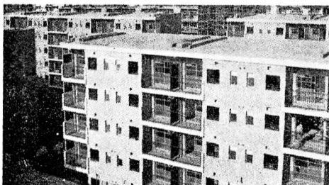
(完成も近い加美平団地)