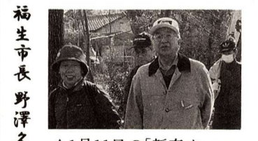
△1月11日の「新春ウォーキング」にて

今年の冬は雪の降る回数が大変多いようです。過日の雪の日、三鷹市で会議があり、帰りに3時間半もかかりました。