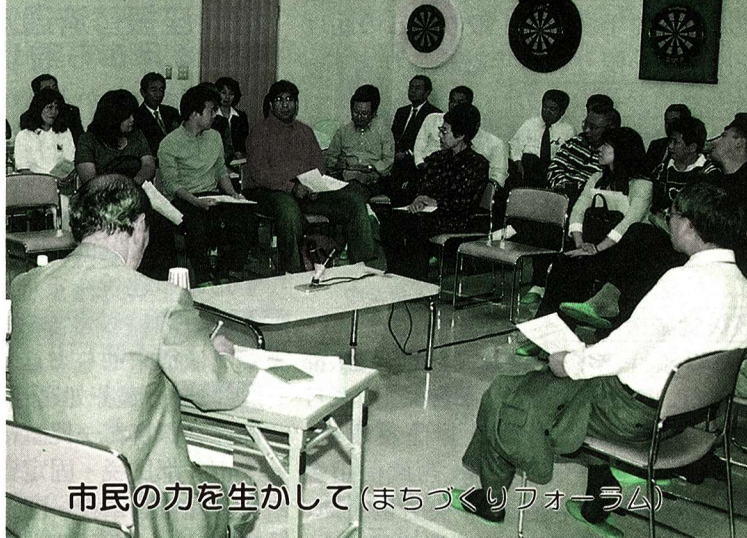
市民の力を生かして(まちづくりフォーラム)

青少年育成・国際化・都市景観・商工業振興・環境の分野で、市民生活に身近なテーマを取り上げ、5回開催しました。市民の方に進行役や話題提供者をお願いし、参加いただいた市民の皆さんと気軽に話し合い、共に考えを深め合う方法により、楽しく進めることができました。延べ176人、17歳の高校生から78歳の男性まで、幅広い層の方の参加を得ました。