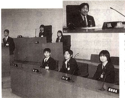
中学生が進路学習で職場訪問しました!