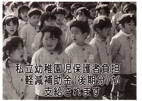
私立幼稚園児保護者負担軽減補助金(後期分)が支給されます

市内に居住(住民基本台帳または、外国人登録原票に記載されている方)し、私立幼稚園及び幼稚園類似の幼児施設に通園している園児の保護者で保育料を納入している次の世帯の方が補助の対象になります。該当する方は、忘れずに申請を。対象①平成13年度に納付すべき市民税の所得割が非課税