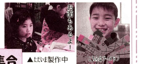
お面もあるよ! ▲たぐい製作中