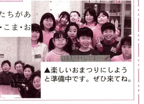
楽しいおまつりにしよう と準備中です。ぜひ来てね。

伝承遊びのコーナーでは地域の方たちがあやとり・おてだま・おはじき・めんこ・こま・おりがみ・うたなどを皆さんの来館を待っています! 一緒に楽しもうよ! 私たちがやさしく教えますよ。