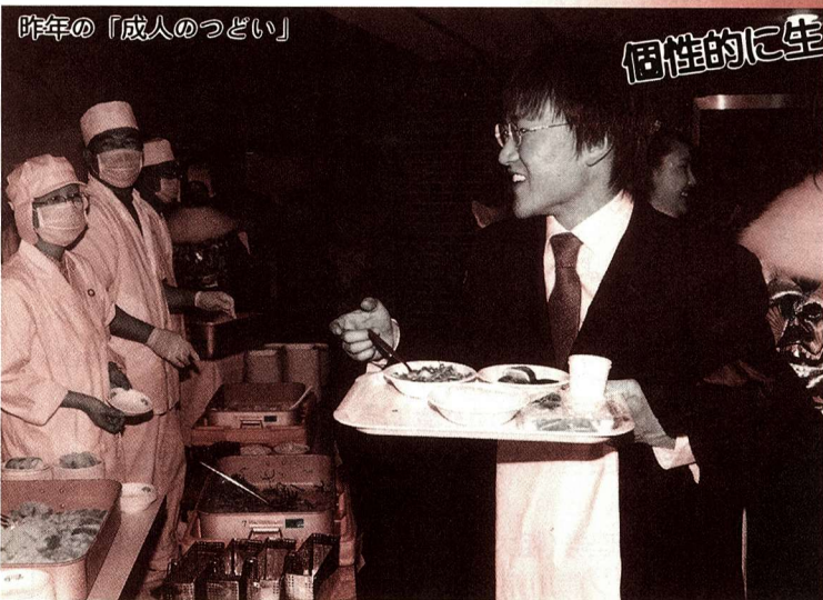
△なつかしの給食コーナー

近年、成人式をめぐって様々な意見が聞かれます。式典中の雑談、酒気を帯びての参加など、参加者のマナーの悪さから成人としての自覚に欠けているといったものです。一方、祝福される成人の方々からは式が時代遅れ、内容が不満、式に出るといふより、久しぶりに会った旧友と話がしたいといった意見です。これは意見の一端ですが、祝福される新成人とお祝いする主催者との意見に相違がみられます。