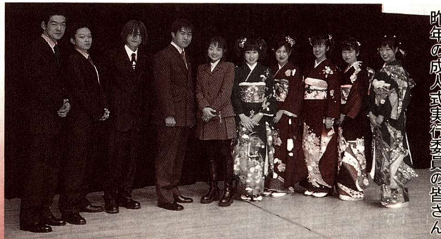
昨年の成人式実行委員の皆さん