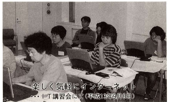
楽しく気軽にインターネット... IT講習会にて(平成13年9月6日)

10月まで実施の初心者パソコン教室に引き続き、11月、12月コースを行います。パソコン超初心者の方のためのメールやインターネットの仕方、文章作成の講習会で。まずはどんなものか試してみてください。初心者同士、わいワイがやがや楽しみましょう。 日時 10月30日(火)から12月21日(金)まで。午前毎日コース(日金)、午後、夜間各曜日コース8回、計20コース実施。詳しくは別表をご覧ください。 場所 福生市プチャラリー第3展示室(福生駅西口エレベーターで4階へ)。 対象 市内在住・在勤・在学の成人の方。内容 パソコンの操作方法とメール、インターネットを体験します。