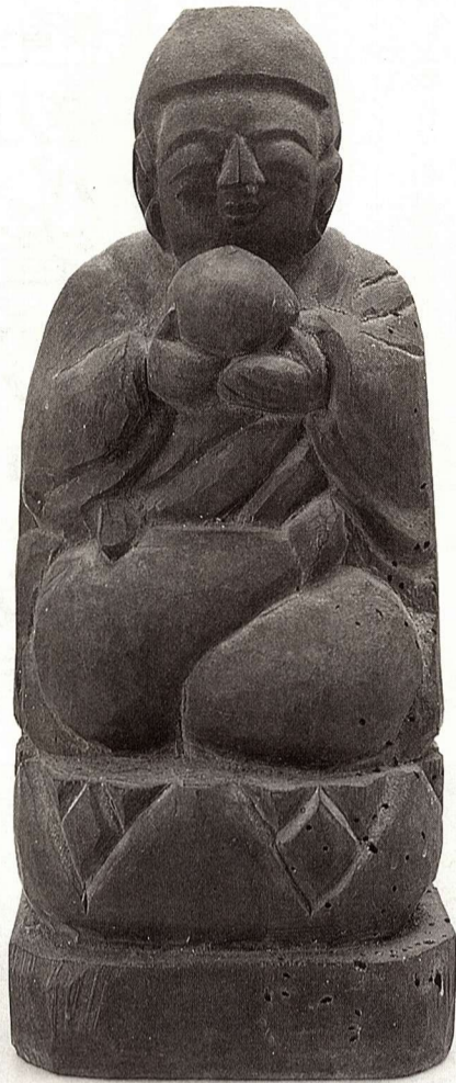
▲薬師如来坐像 19世紀 一木造 木食白道作 法量(高さ30cm 幅13cm 奥行き12cm)