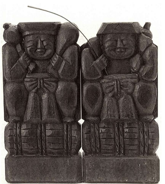
▲恵比寿大黒天像 19世紀 木食白道作 法量(横31cm幅31cm奥行き6.5cm)

今回の展示では、これら多摩地方に伝わる白道の仏像や資料を一堂に展示し、多摩地方での白道の足跡を探り、地域に埋もれてしまっている郷土の貴重な文化