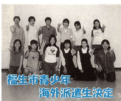
福生市青少年海外派遣生決定

7月23日~8月5日の14日間アメリカ・ユタ州、アリゾナ州へ。ユタ州オグデン市では、8日間のホームステイ、小学校訪問などを通し異文化に対する理解を深め、日本の伝統文化を紹介し、相互理解に努めます。また、ブライスキヤニオン、グランドキャニオンでの野外活動等を通し、アメリカの自然について学習します。