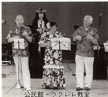
公民館・ウクレレ教室

市では現在、第2期福生市地域福祉計画及び介護保険事業計画に基づき、市民が健康で安心して生活できる福祉のまちづくりを推進しています。 計画の策定にあたっては、学識経験者、福祉保健関係機関、医療関係機関、ボランティア団体、社会福祉協議会及び市民の代表など22名で構成する福生市地域福祉計画推進委員会を設置し、地域福祉に関する意見や基本的な考え方などについて審議、検討をいただいております。 今後も計画を着実に推進していくため、新たに関係機関の方々に委員をお願いするとともに、市民の代表として4名の委員を公募します。 福生市の地域福祉施策などについて関心をお持ちの方、また御意見をお持ちの方は、ぜひご応募ください。 募集人員 4名以内(継続しての応募可) 募集期間 7月