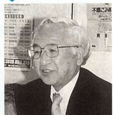
△写真はごみ有料化(案)説明会にて