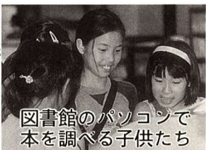
図書館のパソコンで本を調べる子供たち

所蔵館、所蔵場所、貸出中などの状態もわかります。市役所のホームページからも入ることができます。