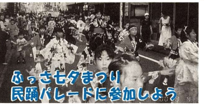
ふっさ七夕まつり 民謡パレードに参加しよう

◆工作トントン「ネームプレート」14日(土)午後2時30分~4時30分 対象小学生以上24人 申込み:5日午後4時~4時30分、持ち物はアルミ缶 ※材料費20円