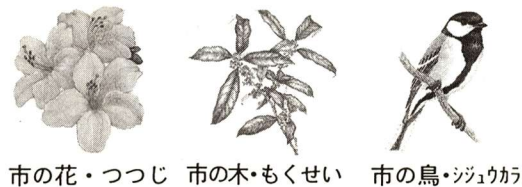
市の花・つツジ 市の木・もくせい 市の鳥・シヅウカ